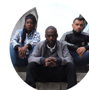
JAASCAÏ & AMOS CONCERT RAP