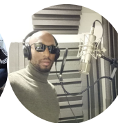
LET'S PRAISE GOD CONCERT GOSPEL