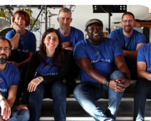
LOUANGE FLEX LOUANGE